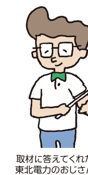
取材に答えてくれた東北電力のおじさん

毎日あたりまえに電気を使っているけど、たくさん燃料を使ったり、外国の問題があったり、電気をつくるのは大変なことだと分かったニヤ。料金が高くなるのもいろいろニヤ理由があつて、電気を大事に使わなければいけないと思つたニヤ。今後、積極的に取材して、スクープを狙っていくニヤー！