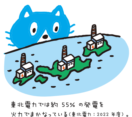
東北電力では約55%の発電を火力でまかっている(東北電力：2022年度)。

東北電力の電気は、多くが火力発電でつくられていて、その燃料は海外からの輸入にたよっている！その燃料価格が「世界情勢や円安のせい」で高くなっているニヤ。