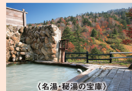
〈名湯・秘湯の宝庫〉