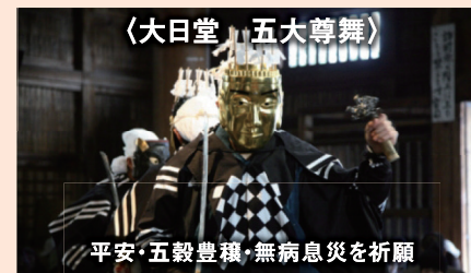
〈大日堂・五大尊舞〉