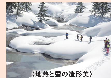
〈地熱と雪の造形美〉