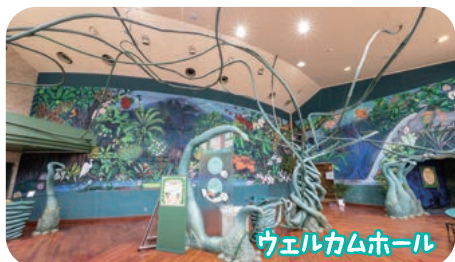
ウェルカムホール

ここは生命の森への第一歩。ロビーに広がる「エナジー樹」はエネルギーの木で、これから始まる森の物語の案内役をします。