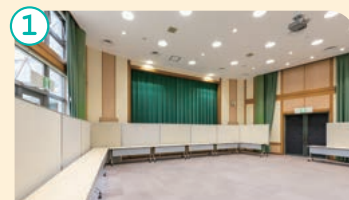
カルチャーホール(サザンドームのしる内)

エナジウムパークによる催し物はもちろん、講演会やセミナーなど地域の文化活動にもご利用いただけます。