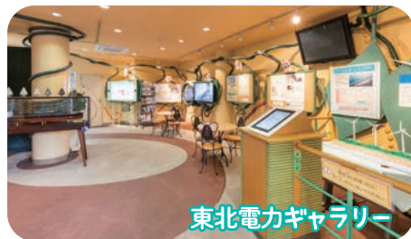
東北電力ギャラリー

能代火力発電所の仕組みや地球環境を守るための取り組みなどについて学ぶことができるギャラリーです。