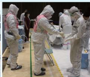
放射線測定器による体表面汚染の検査を行う発電所員

今回の訓練で私は、搬送先の医療機関において、負傷者に付着した放射性物質が周辺に拡散しないために必要な対応を改めて確認しました。