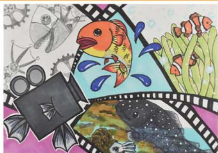
「色々な時代を映す 映写機フィッシュ」