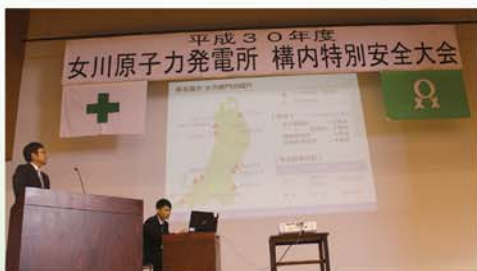
「安全基本ルールが一人ひとりに伝わる仕組みの展開について」と題した安全講話

これからも、安全の基本ルールをしっかり順守し、発電所員および構内協力企業社員が一丸となり、安全最優先で各種作業に取り組んでまいります。