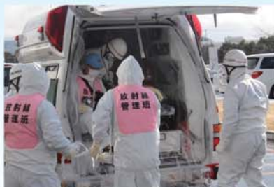
負傷者を石巻赤十字病院(原子力災害拠点病院)へ搬送