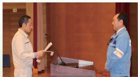
労働災害発生防止の決意表明