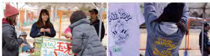
● 女川町復興祭ではステージのサポートに、玉こんにゃく販売で大忙し