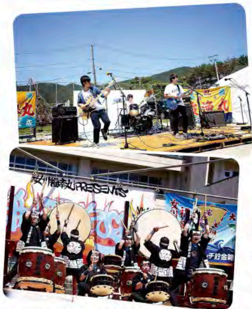
● 女川町在住者や町に縁のあるアーティストが出演

このコーナーでは、地域に根ざしてがんばっている人や団体をご紹介します。地域に暮らす仲間の活躍が、皆さんの活力につながりますように…。