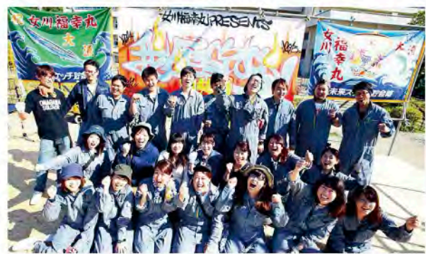
● 「我歴STOCK」の名は、「震災で瓦礫と呼ばれたものは私たちがこの町で生きてきた証、歴史そのもの」とし、さらに新しい時代をストック(積み上げる)していくという思いが込められている

「我歴STOCK in 女川 ~共鳴編~」開催決定! ★とき 2016年7月10日(日) ★場所 シーバルピア女川 ★Web http://www.onagawa-fkm.com/