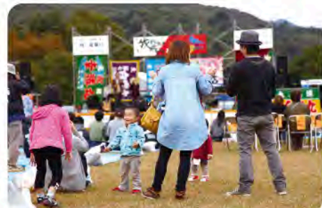
● 幅広い年齢層が楽しめるイベントを目指している