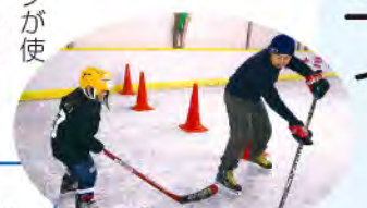
●体験も随時募集中です