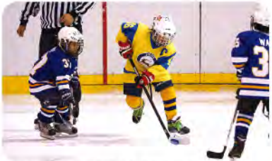
●基本技術を磨き突破力を身につけます