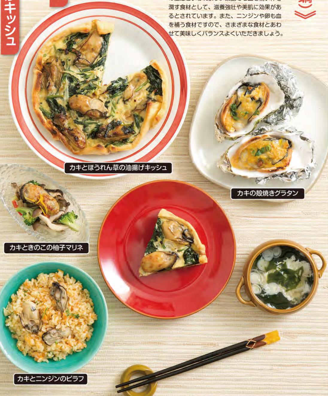
カキとほうれん草の油揚げキッシュ

カキにはグリコーゲンやタウリンをはじめ、カルシウム、鉄、亜鉛が多く含まれ栄養の宝庫といわれます。薬膳でも血を補い体を潤す食材として、滋養強壮や美肌に効果があるとされています。また、ニンジンや卵も血を補う食材ですので、さまざまな食材とあわせて美味しくバランスよくいただきます。