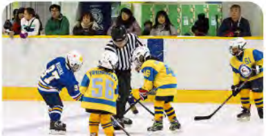
●フェイスオフで試合再開。攻めるチャンスです