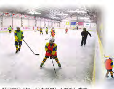
●練習試合では上級生が優しく対戦します