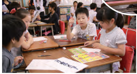
●グループでカロリーを計算しながらおやつメニューを考案中