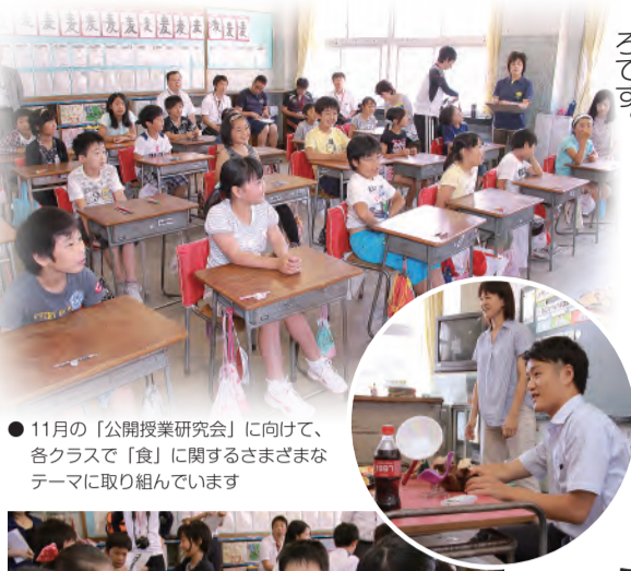
●11月の「公開授業研究会」に向けて、各クラスで「食」に関するさまざまなテーマに取り組んでいます

6年生は大豆を栽培しています。枝豆のうちに収穫して、ゲストティーチャーと呼ばれる地域の方々に教えていただきながらずんだを作ります。指導するゲストティーチャーによってレシピが異なるため、グループ毎に微妙に味が違うのも興味深いところです。