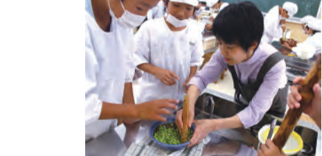
●ゲストティーチャー（地域の方々）が色々なことを教えてくださいました

秋にはおにぎりりと水だけを持って出かける「おにぎり遠足」を行います。1年生から3年生は往復10キロほど、4年生から6年生は往復12キロほどの道を歩きます。おやつは持っていないきません。ご飯と水のおいしさを実感することをねらいとして行っているもので、たくさん歩いてお腹を空かせてから食べるおにぎりの味は格別によいです。「水もいつもより美味しく感じた」という感想もありました。