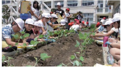
●種から育てた大豆を植え替えた翌日、元気に育っている様子を観察しました