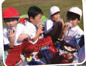
●たくさん歩いたあのおにぎりの味は最高です!!