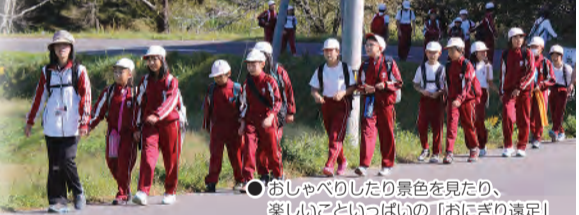
●おしゃべりしたり景色を見たり、楽しいこといっぱいのおにぎり遠足!