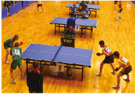
● 全国大会では独特な緊張感に包まれた雰囲気 のなか、自分たちの力を発揮しました