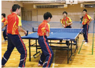
● 飯中卓球部のモットーは「明るく楽しく」です