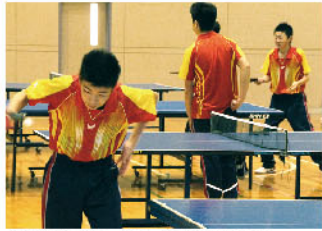
● 練習でも一打一打が真剣勝負