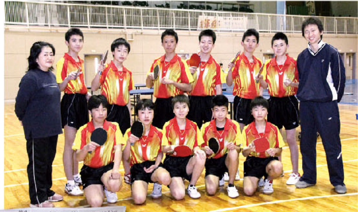
● 全国大会に出場してから技術面も精神面もさらに向上しています