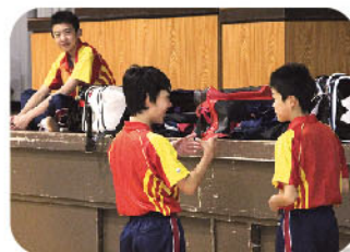
● 休憩中はおしゃべりしたり、ときには「鬼ごっこ」をすることも