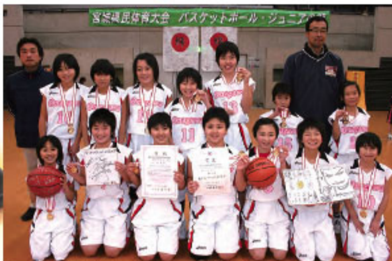
●ご支援いただいた方々のために、そして先輩たちの分まで、全国大会で一生懸命プレーします! (写真は昨年12月末の宮城県予選で優勝したときのもので)