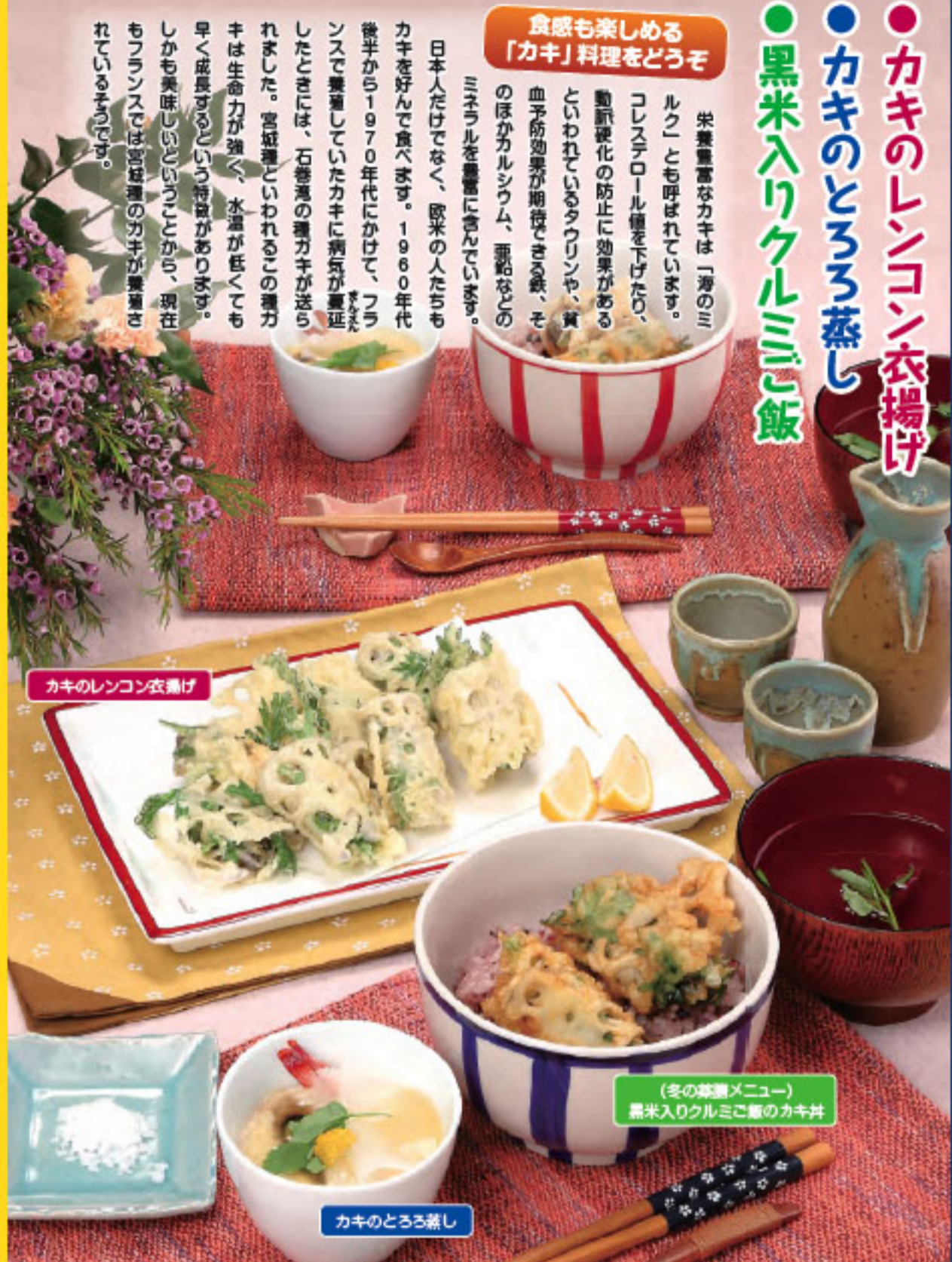
カキのレンコン衣揚げ