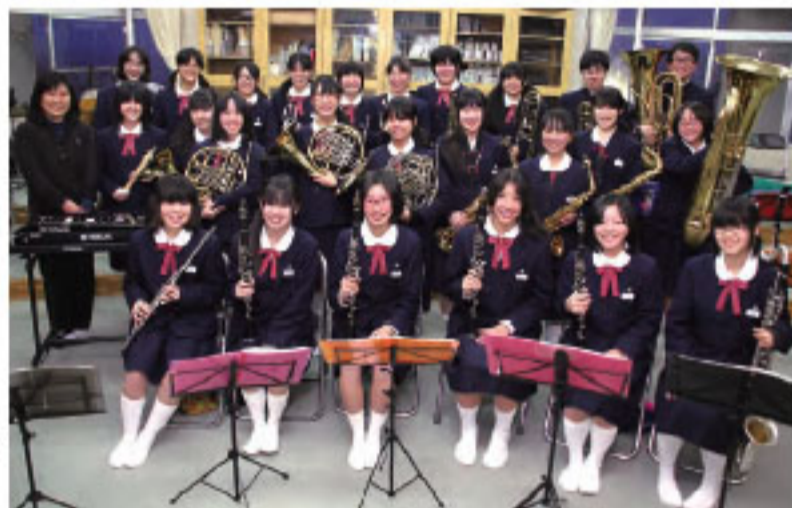
●2月5日に「石巻地区吹奏楽祭」、3月20日に「スプリングコンサート」を予定していますので、ぜひ聴きにいらしてください!