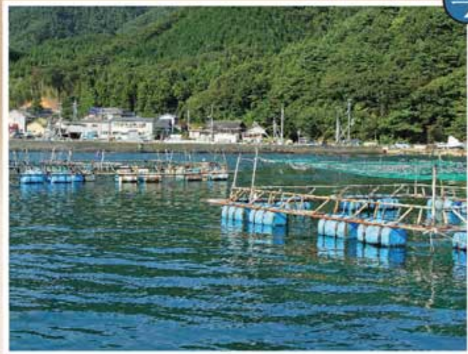
岸辺が埋め立てられ、ノリに代わってギンザケ養殖のいかだが浮かぶ