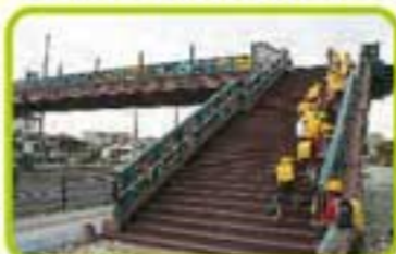
▲サンファン号の木造船をイメージした蛇田歩道橋

「ふれあい文化祭」は蛇田小学校の恒例行事で、午前中に学習発表、お昼から午後にかけて野菜の販売やPTAのバザーなどが行われます。昨年度はインフルエンザの流行で中止となったこともあり、楽しみにしている地域の方々から今年の開催について問い合わせがあるほどです。