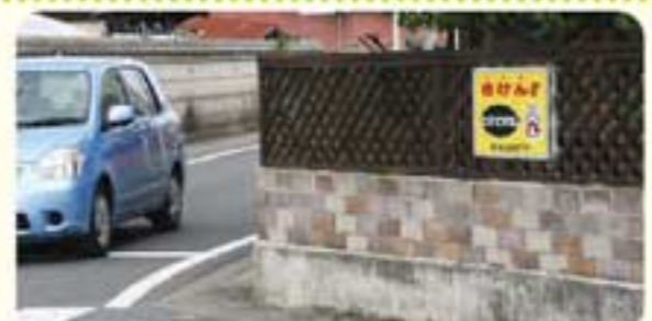
▲街角には注意を促す看板が設置されています

このマップを使って、子どもたちは安全に通学しています。子どもたちは、朝はそれぞれ登校しますが、帰りは学年毎に集団下校をしています。多くの子どもたちが通学路には、サン・ファン・パウティスタ号をモチーフにした蛇田歩道橋があります。歩道橋を彩るスタンドグラスは、平成8年度に蛇田小学校の5・6年生が描いたものです。子どもたちは先輩たちの作品に見守られながら登下校しています。