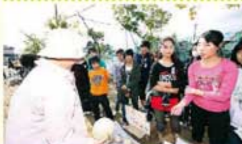
▲6年生が育てた野菜の販売は地域の方々も楽しみにしています