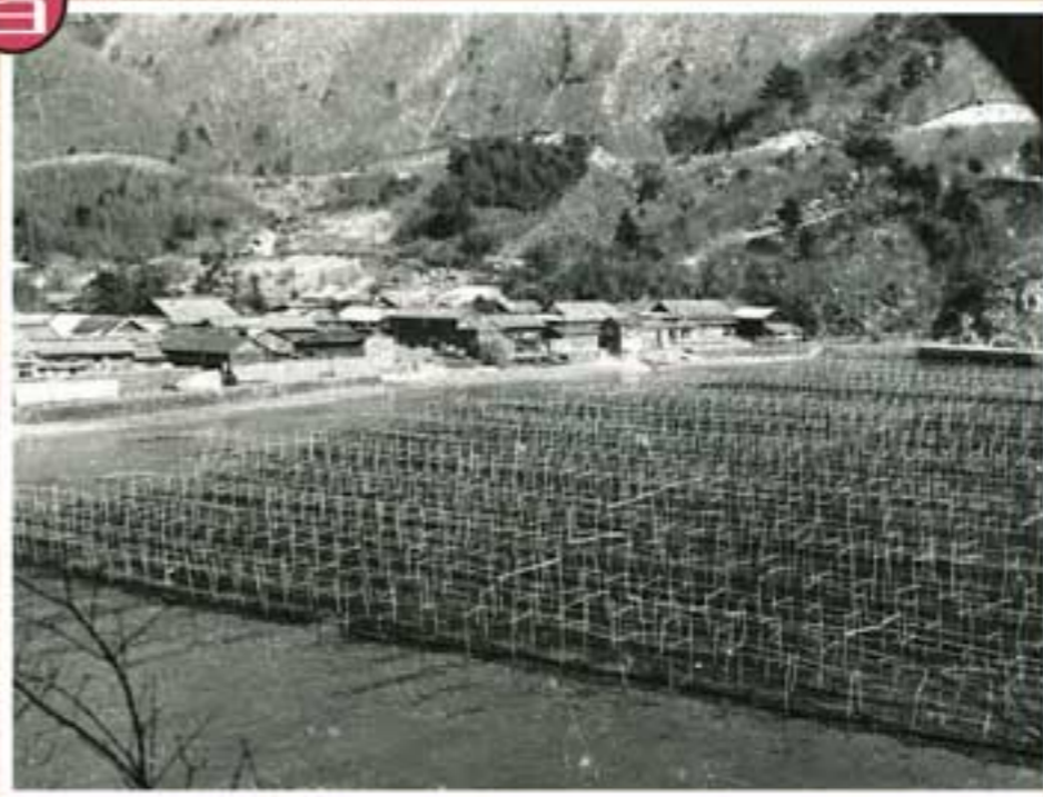
女川町桐ヶ崎地区の高内一面をノリ養殖の支柱棚が埋め尽くす

金華山沖は暖流と寒流がぶつかる豊かな漁場です。女川港は沿岸漁業ばかりでなく、沖合・遠洋漁業の拠点として賑わってききました。それぞれの旬の時期によって、サンマ、カツオ、マグロ、イカなど多様な魚が豊富に水揚げされています。捕る漁業に加えて養殖も盛んで、女川湾では養殖用のいかだを多く見ることが出来ます。 女川湾で養殖されてきた海産物はさまざまです。なかでも産業としてのワカメの養殖は、日本では女川町小乗浜で初めて成功したことが知られています。養殖の歴史が古いものとしてはノリがあげられます。日本のノリ養殖の歴史はカキについで古く、宮城県では安政元年（1854年）に気仙沼湾で始まったのが最初と記録されています。女川町で始まったのは明治時代後半といわれ、昭和40年代後半になると出島を中心として外洋性漁場にも浮き流し養殖法が広がり、昭和50年代にかけて活況を呈しました。