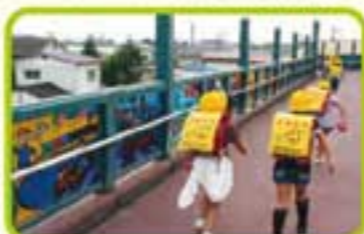
▲先輩たちが描いたスタンドグラスが通学路を彩ります