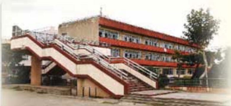
▲校舎と校庭を結ぶ歩道橋が学校の特徴