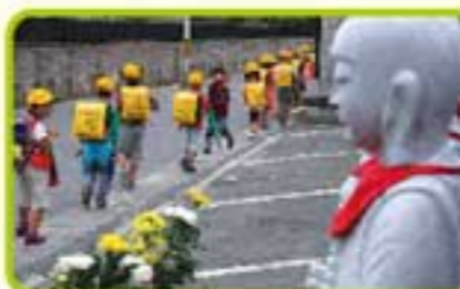
▲おじょうさんに見守られて下校します

このマップを使って、子どもたちは安全に通学しています。子どもたちは、朝はそれぞれ登校しますが、帰りは学年毎に集団下校をしています。多くの子どもたちが通学路には、サン・ファン・パウティスタ号をモチーフにした蛇田歩道橋があります。歩道橋を彩るスタンドグラスは、平成8年度に蛇田小学校の5・6年生が描いたものです。子どもたちは先輩たちの作品に見守られながら登下校しています。