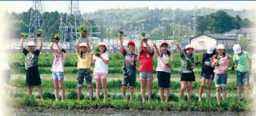
▲5年生は田植えから稲刈りまでを楽しく体験します