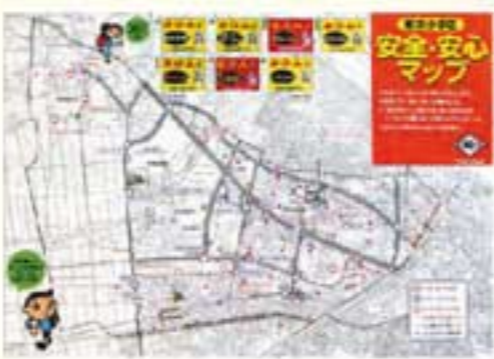
▲安全・安心マップ