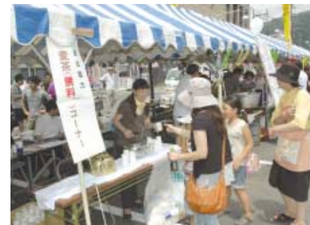
▲麦茶と風船を来場者にプレゼントしました

また、大型の桶に三人一組で乗りスピードを競う“海上コガ漕ぎレース”やパレードにも参加し、地域の皆さまと一緒にお祭りを盛り上げました。