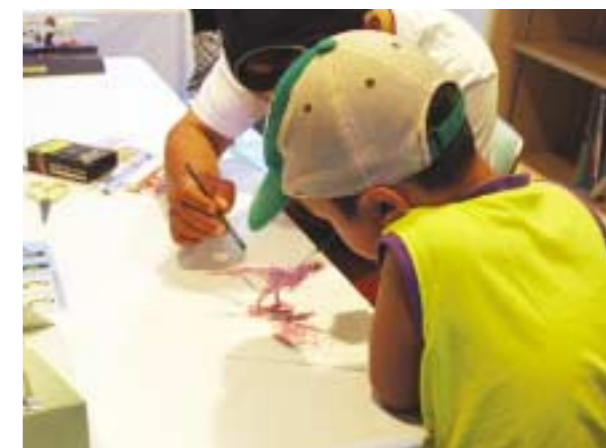
▲好きな色を塗ってオリジナルのフィギュアづくりに挑戦

※ 食品玩具の略。「おまけ」として玩具を添付した食品や飲料の商品形態の総称です。