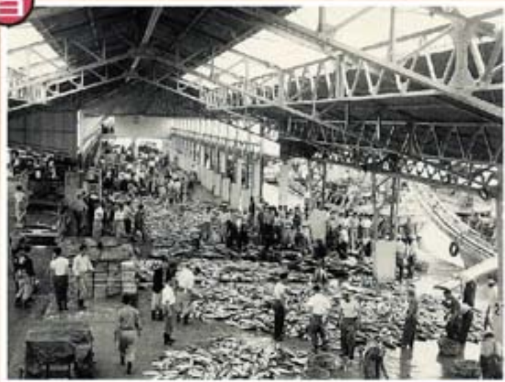
大勢の仲買人が水揚げされた魚の山を見定めています。

金華山沖は東海と親潮が合流する豊かな漁場で、かつては漁によって水揚げされた魚介類の扱いが主でした。しかし、近年ではキンザケ、カキ、ホタテなどの養殖技術が進み、「とる漁業」だけでなく、「つくる漁業」「育てる漁業」の割合も増加しています。 日本の魚介類の国内生産量は、昭和59年のピークから平成17年には半分に減少しました。各地の市場では経営が難しくなってきた所も多くなり、女川魚市場では平成18年に第三セクターによる株式会社女川魚市場が設立され、同年4月に業務を開始しました。ここには新鮮な魚介類を運搬できる「魚市場食堂」をオープンさせるなど新たな取り組みも行われています。