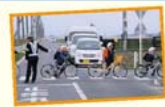
地域の人たちに見守られて安全に通います。