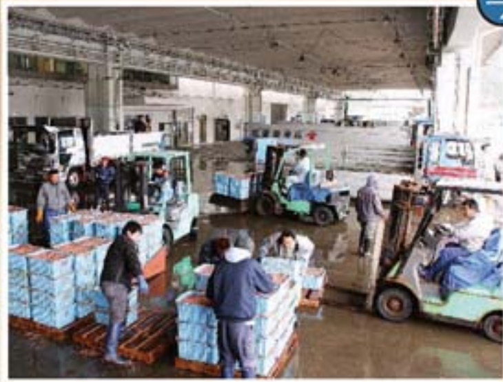
作業効率の高さと衛生的な環境で、水揚げと荷積みを行っています。