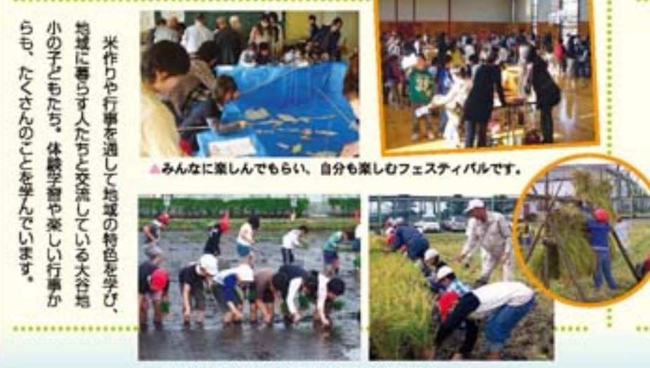
みんなに楽しんでもらい、自分も楽しむフェスティバルです。