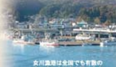
女川漁港は全国でも有数のさんまの水揚げ場を誇ります。

金華山沖は東海と親潮が合流する豊かな漁場で、かつては漁によって水揚げされた魚介類の扱いが主でした。しかし、近年ではキンザケ、カキ、ホタテなどの養殖技術が進み、「とる漁業」だけでなく、「つくる漁業」「育てる漁業」の割合も増加しています。 日本の魚介類の国内生産量は、昭和59年のピークから平成17年には半分に減少しました。各地の市場では経営が難しくなってきた所も多くなり、女川魚市場では平成18年に第三セクターによる株式会社女川魚市場が設立され、同年4月に業務を開始しました。ここには新鮮な魚介類を運搬できる「魚市場食堂」をオープンさせるなど新たな取り組みも行われています。