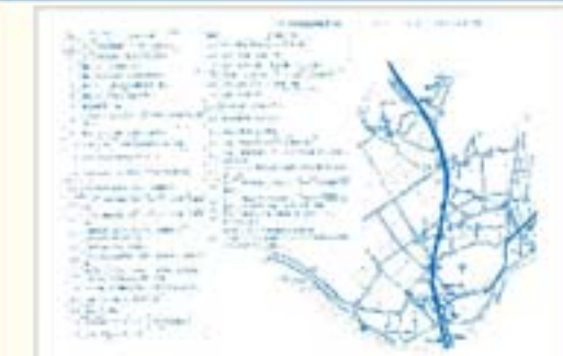
通学路のマップには、注意が必要なポイントが書かれています。