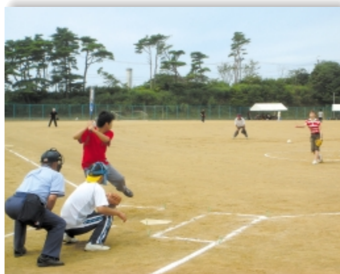
▲グラウンドでは白熱した試合が展開されました