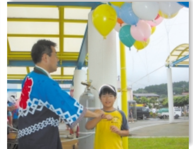
▲鯨まつりでの風船サービスはお子さんたちに喜ばれました