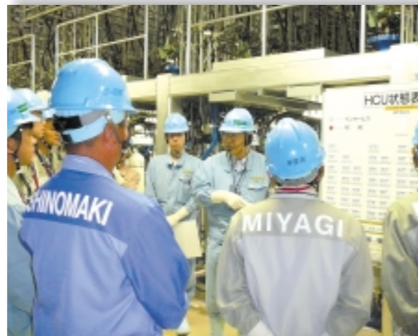
▲3号機原子炉建屋内の水圧制御ユニットなどを確認いただきました