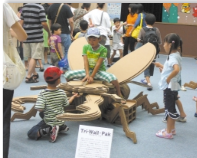
▲強化ダンボールで作った全長2mのノコギリクワガタはお子さんたちに大人気でした