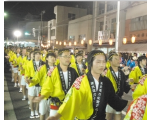
▲川開き祭りのフィナーレを飾る大漁踊り