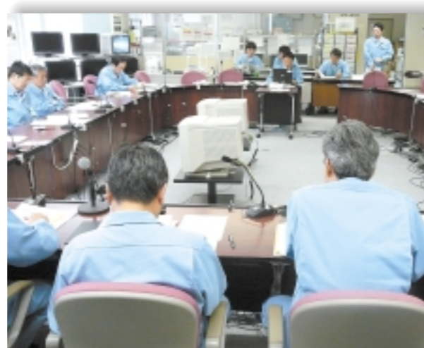
▲本番さながらの訓練に、参加者全員が真剣に取り組みました

今後とも定期的に非常災害対策訓練を実施し、災害への対応能力向上を図ってまいります。