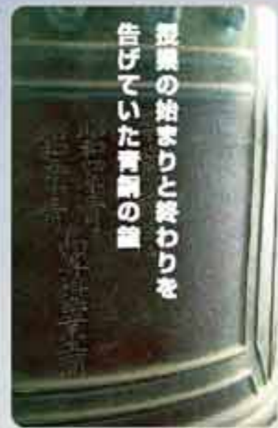
授業の始まりと終わりを告げていた青銅の鐘

明治6年に開校した雄勝小学校。すぐ近くに雄勝湾が広がり、学校の裏手には山があるという自然に恵まれた環境のなかで、1~4名の児童が学んでいます。