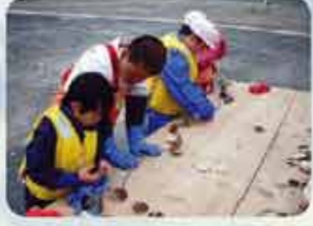
春に行うホタテの耳吊り作業