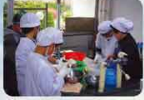
水揚げしたホタテを調理して振る舞いました