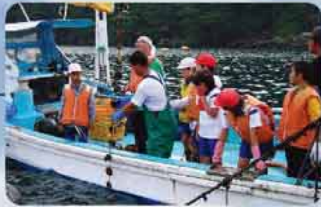
ホタテの養殖体験は保護者の協力があるからこそ

地域の環境もお宝の一つです。学年によって、雄勝の特産品である玄呂石(雄勝石)スレートに絵を描いたり、工場見学を通して地域の産業を学ぶほか、5年生は保護者の協力のもとホタテの養殖体験を行っています。耳吊り、採苗器の投入と回収、水揚げなど、体験は年4回にも及びます。昨年度は水揚げの翌日にホタテ飯などを作って、招待した地域の方に振る舞いました。ホタテの調理法は地域の婦人団体のメンバーに教わりました。