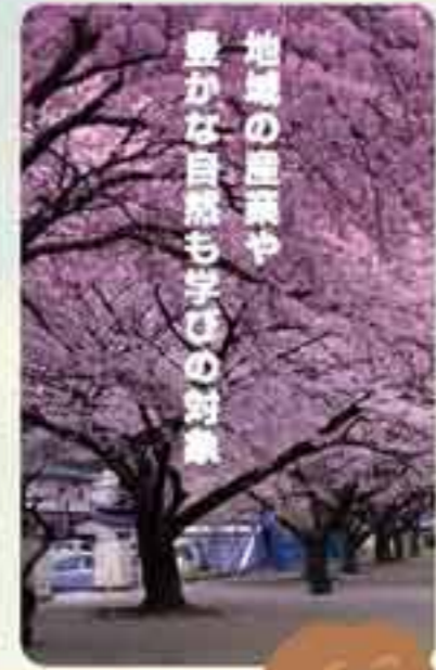
地域の産業や豊かな自然も学校の対象

雄勝小のお宝は、正面玄関に飾られている青銅の鐘です。「昭和4年3月・5年3月高等科卒業生」と書かれてあるこの鐘は、校舎改築の昭和41年まで、始業と終業の合図に鳴らされてきました。それ以降も、今から10年ほど前まで、正面玄関の脇に吊されて、児童たちが鳴らしていたそうです。