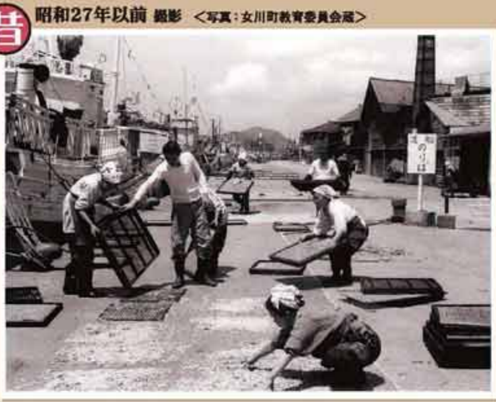
角浜(現在の蟹神)でのシラス干し風景。丁寧に手作業でシラスを天日で干す工程は、この頃から変わらずに受け継がれている。