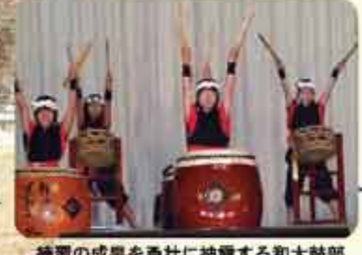
練習の成果を勇壮に披露する和太鼓部

このように、学校内だけでなく、周囲の自然環境や、温かく見守ってくれる地域の人たちまでが、雄勝小の児童にとっての学舎であり先生であるようです。