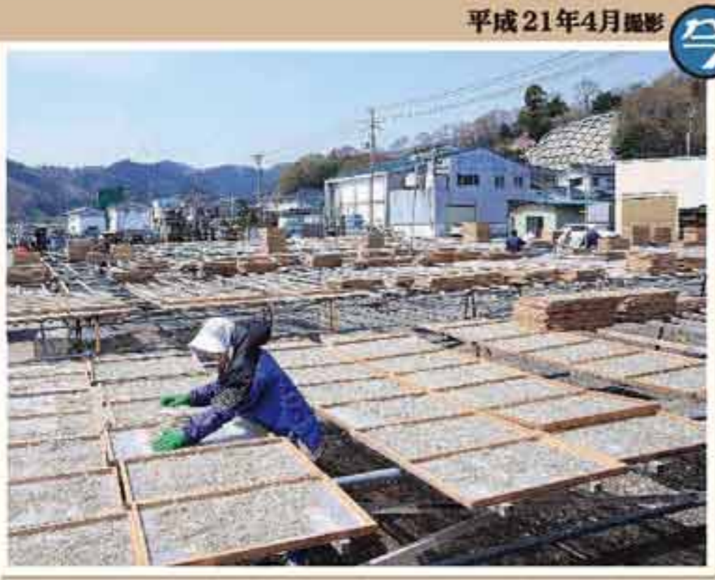
シラス干し専用の木枠の網が一面に広げられた風景は、まるで雪が降り積もったよう。

春の便りが届く4月上旬から、晴れた日の女川の浜は、雪が降り積もったように白く見えます。風物詩ともなっているシラス干しの風景です。