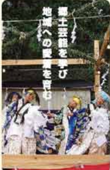
郷土芸能を学び地域の産業を学ぶ

このように、学校内だけでなく、周囲の自然環境や、温かく見守ってくれる地域の人たちまでが、雄勝小の児童にとっての学舎であり先生であるようです。