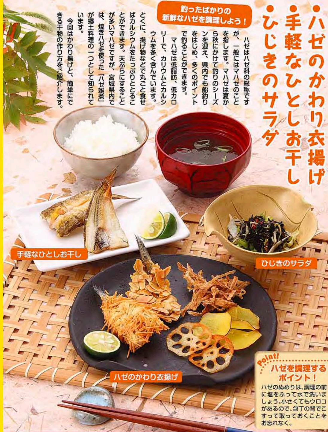
手軽なひとしお干し