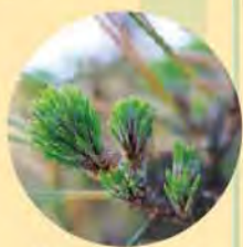
新しい葉が芽吹いた校木の「そなれ松」

学校のシンボルである「そなれ松」(クロマツ)は、昭和22年に校木に指定され、昭和30年代の校舎移転の際に、現在の場所に移植されました。枯れそうになっていたため、昨年、樹木医に処置してもらったのですが、樹木医には「もう息を吹き返さないかもしれない」と言われました。