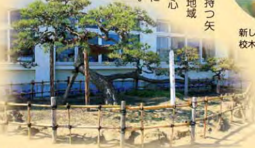
地域のみなさんの熱心なお世話により元気になりました

しかし、地域のみなさんが入れ替わりやってきて世話をしていたところ、今年になって青々とした新しい葉がたくさん芽吹いてきたのです。地域のみなさんのやさしい気持ちや、児童たちの応援が、高齢の松の木に伝わったのでしょうか。