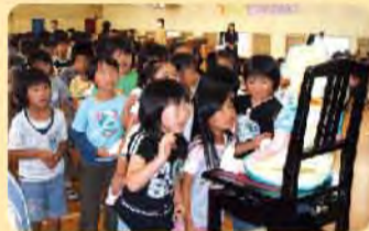
贈られた人形を見つめる児童たち

矢本東小学校の歴史は古く、創立は明治6年です。その後、旧矢本小学校を経て、昭和53年に矢本東小と矢本西小の二つの学校に編成されました。現在は619名の児童が元気に学んでいます。