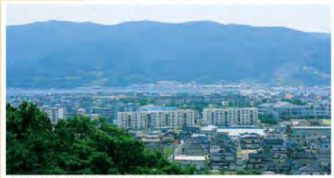
◆現在の流留・渡波地区の風景(平成20年撮影)