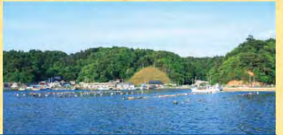
青と緑のコントラストが美しい夏の出島