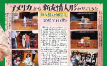
エンジェルちゃん