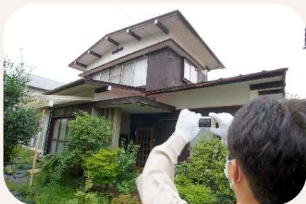
害虫の巣や塀の破損の有無を目視確認