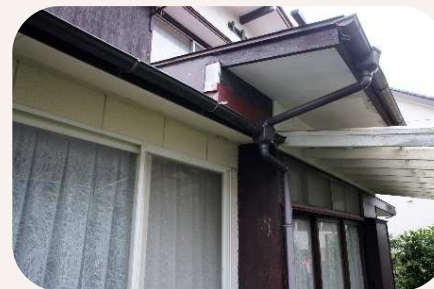
雨樋の破損の有無を目視確認