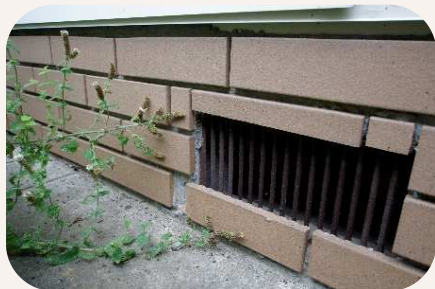
建物外壁の破損の有無を目視確認