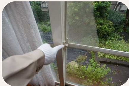
窓の戸締り確認や換気