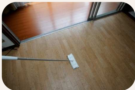
各部屋および廊下の簡易清掃（乾拭き）