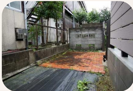
敷地内の不審な車を確認