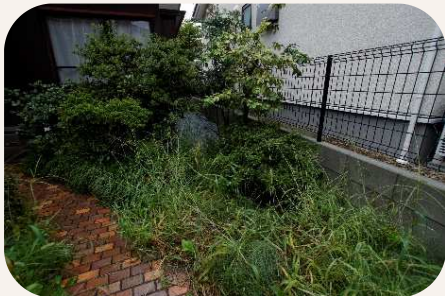
草木の繁茂や隣家への越境を確認