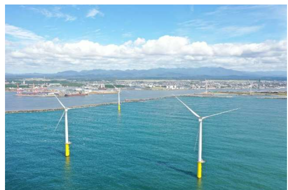
秋田港洋上風力発電所