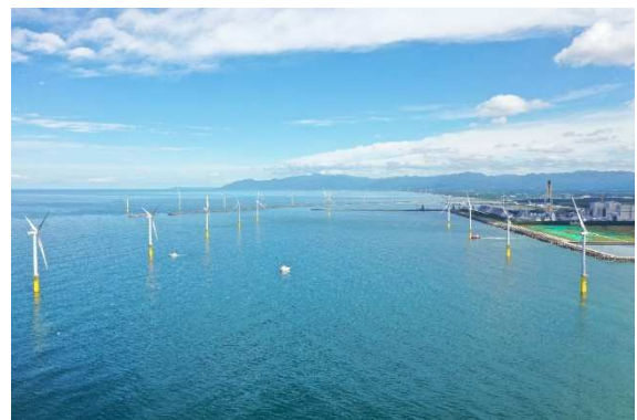
能代港洋上風力発電所