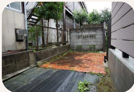
敷地内の不審な車を確認