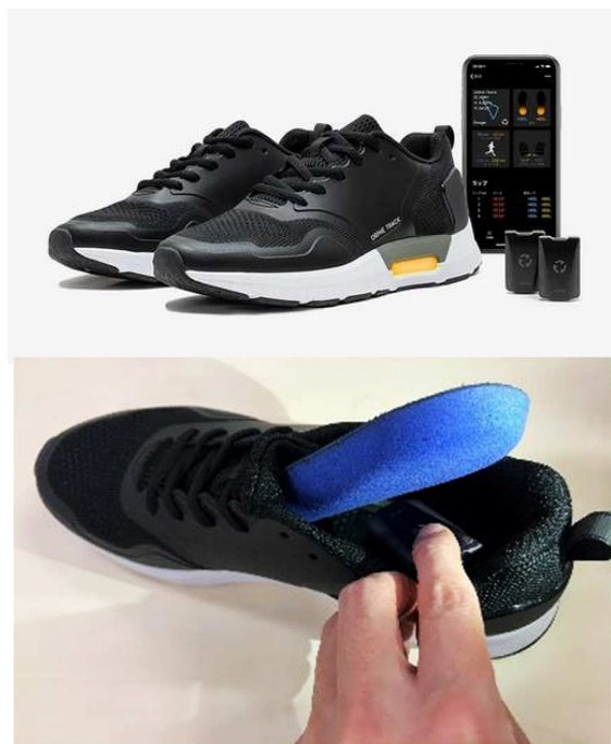
中敷きを外した「土踏まず」部分にモーションセンサーをセット