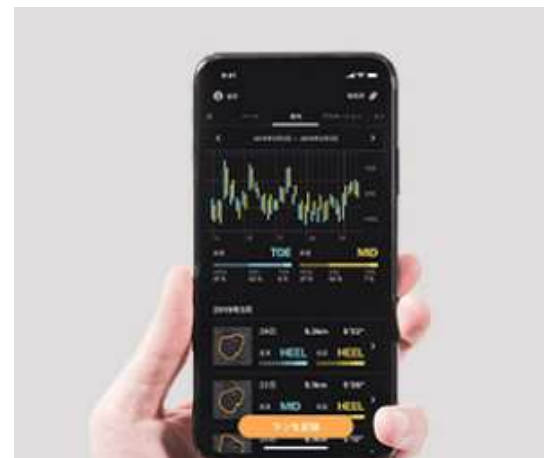
スマートシューズが取得可能なデータ