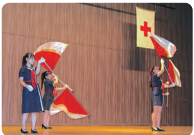
●コロナ禍で活動を休止していたカラーガード部の再始動初ステージは学校祭でした