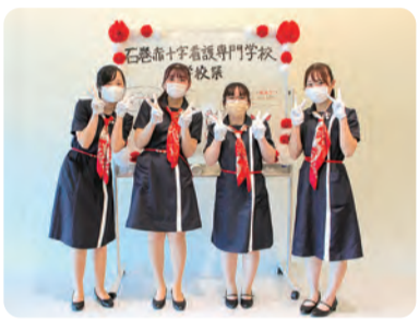
●1、2年生4名は意見を交わしながら練習を重ね学校祭のステージに立ちました。3年生の先輩は実習で忙しく練習をする時間が取れなかったことから、音楽を流したり、後輩たちの演技を確認するなど裏方として活動を支えてくれました