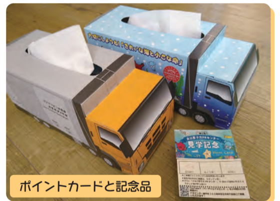
ポイントカードと記念品