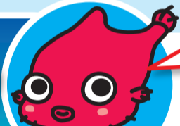
女川原子力PRセンターのキャラクター タンゴウオの「ごろたん」