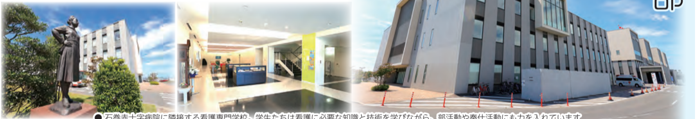
●石巻赤十字病院に隣接する看護専門学校。学生たちは看護に必要な知識と技術を学びながら、部活動や奉仕活動にも力を入れています

看護師を目指して知識や技術を学びながらも練習を重ね、機会があれば地域の催しなどでもパフォーマンスを披露したいと考えているカラーガード部。これからも華やかな活動で地域を盛り上げてくれることでしょう。