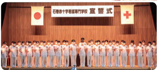
●病院実習の前に、看護への責任と誇りを自覚する「宣誓式」。ナイチンゲールの灯火を受け取り、看護を職業とする志を確認します