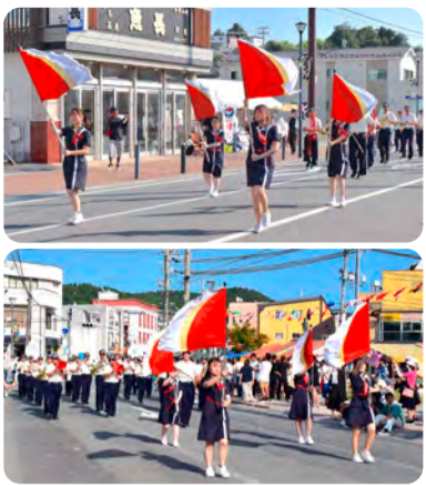
●石巻川開き祭りでは、石巻広域消防音楽隊の皆さんと多くの観客の前で演技を披露しました

カラーガード部が創部したのは新校舎に移ってからの2016年度です。当時、カラーガードをやりたいという熱い想いを持った学生がいて、自分たちで企画書を作成するなどして創部にこぎつけました。演技の練習や構成だけでなく、フラッグやコスチュームをそろえるなど、創部時ならではの苦労がありました。熱意で乗り越えてきました。