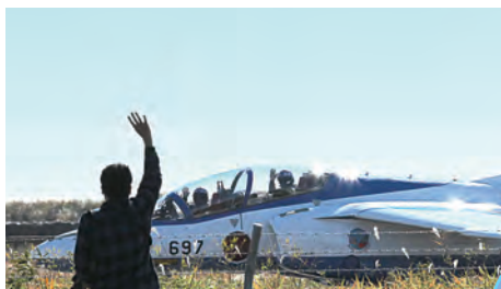
●手を振ってもらえることがパイロットの励みの一つ