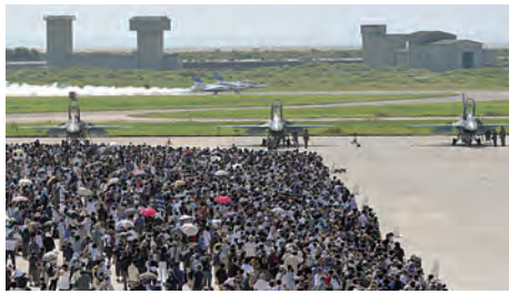
●多くの観客が注目する離陸の様子