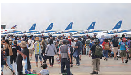
●地元だけでなく県外からも多くの人が訪れる航空祭 ※今年は新型コロナウイルスの影響で中止となっている