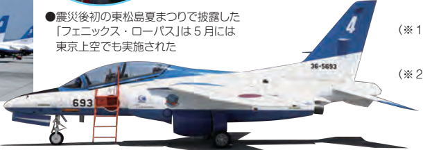
●ブルーインパルスは機体の形がイルカに似ていることから「ドルフィン」の愛称で親しまれている

●震災後初の東松島夏まつりで披露した「フェニックス・ローバス」は5月には東京上空でも実施された