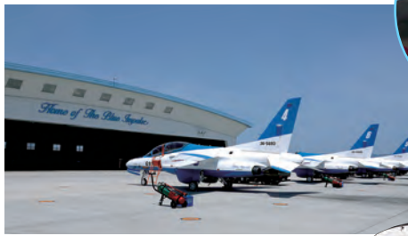
●ドルフィンキーパーによって整備・点検され、きれいに磨きあげられたブルーインパルス