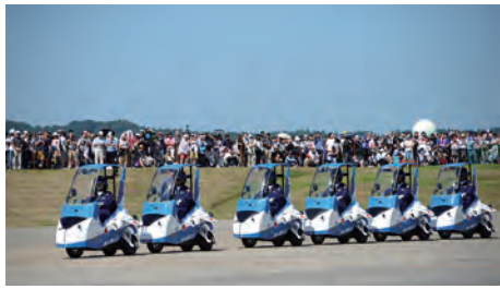
●松島基地のクラブ活動の一つ「ブルーインパルスジュニア」は航空祭などで見事な曲芸走行を披露している