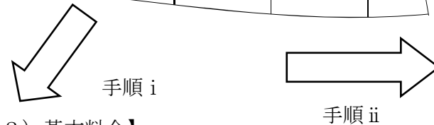
左表【標準契約書(別紙2)基本料金】