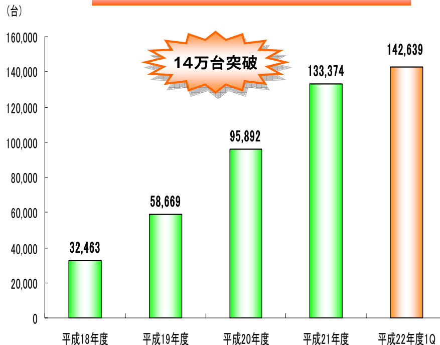
エコキュート累計導入実績